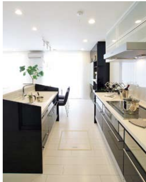
写真4点はすべて「くさつみらい緑風苑 第VI期」モデルハウス