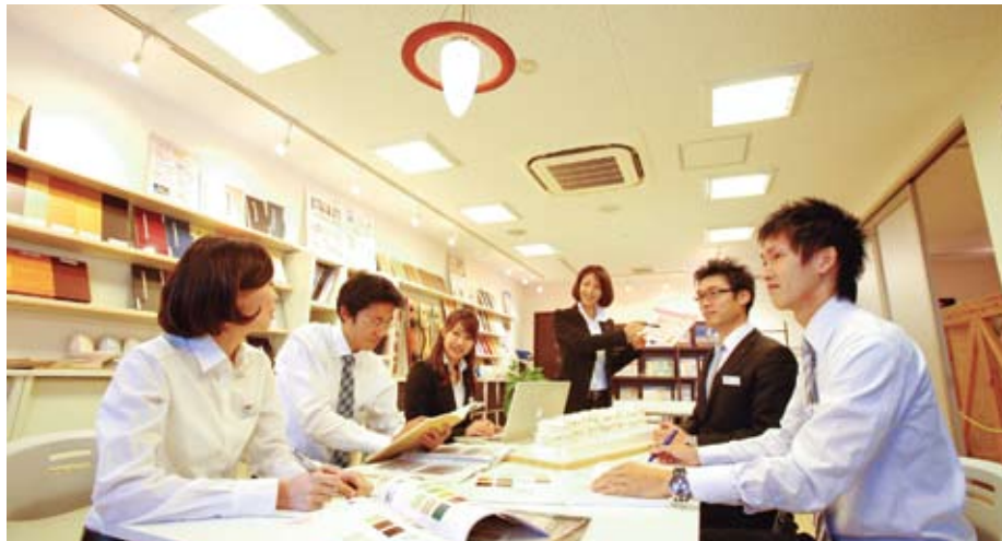
設計チームの打ち合わせ風景。各々が高いモチベーションを持ち、積極的に意見を交わす(「拓伸・住まいのショールーム草津東店」にて)