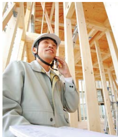
上：細やかな心配りを欠かさず、笑顔で接客する受付スタッフ 下：常に整然と整理された建築現場は、現場スタッフのお客様に対する意識の高さを窺わせる。誰もがハツツツとして礼儀正しい