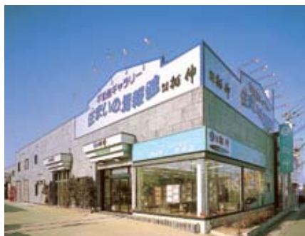
本社・住まいの情報館/草津店