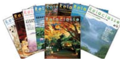
拓伸の暮らし情報フリーマガジン